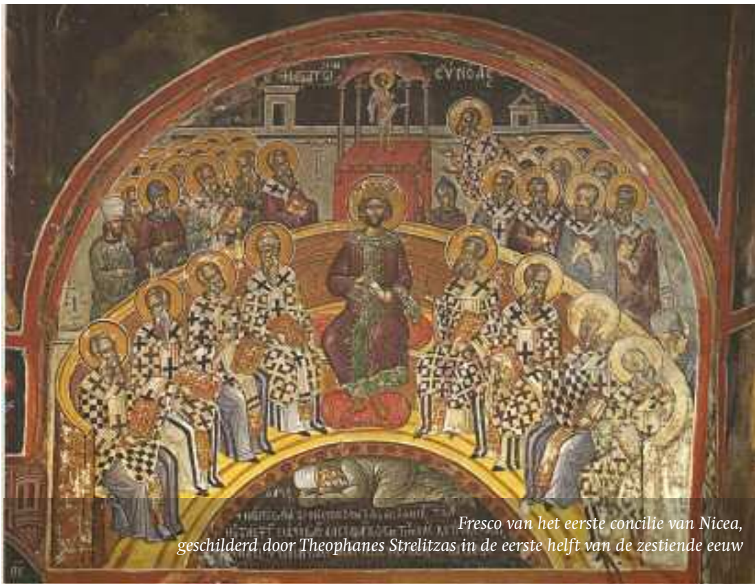
Fresco van het eerste concilie van Nicea, geschilderd door Theophanes Strelitzas in de eerste helft van de zestiende eeuw

De tekst die in 325 werd vastgesteld, werd in 381 aangevuld tijdens een nieuw oecumenisch concilie, nu in Constantinopel. Daar gingen de besprekingen voornamelijk over het wezen van de Heilige Geest. Theologisch gezien nam men in Constantinopel dezelfde beslissing als in Nicea: ook de Geest is voluit God, net als de Vader en de Zoon. De zogenoemde Goddelijke Drie-eenheid was daarmee een dogma geworden, een onbetwistbare leerstelling.