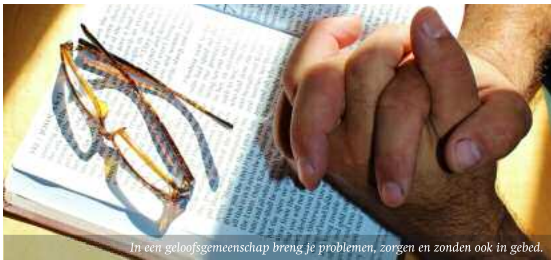
In een geloofsgemeenschap breng je problemen, zorgen en zonden ook in gebed.

Een terugloop in financiële mogelijkheden veroorzaakt dat de neerwaartse spiraal blijft bestaan. Minder betaalde werkers kunnen minder dienstwerk verrichten. Als er meer on-