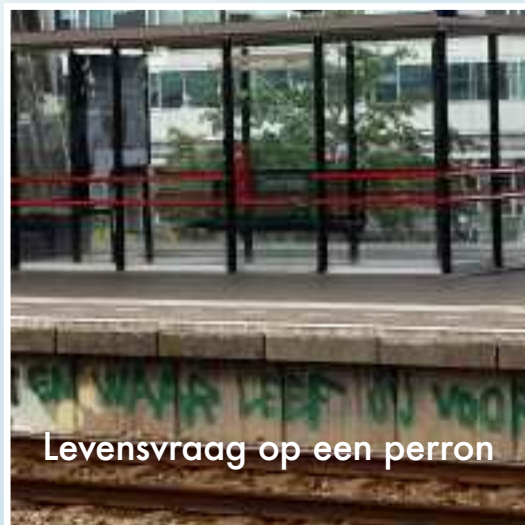
Levensvraag op een perron

Rust, reinheid, regelmaat in het klooster