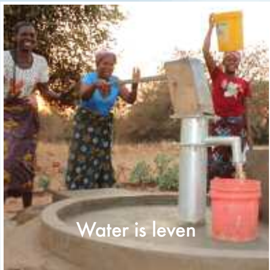
Water is leven