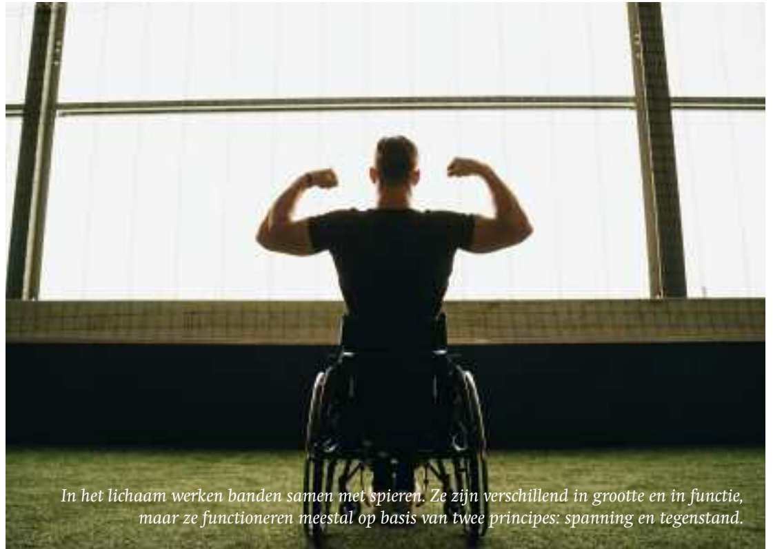
In het lichaam werken banden samen met spieren. Ze zijn verschillend in grootte en in functie, maar ze functioneren meestal op basis van twee principes: spanning en tegenstand.

De banden zorgen er dus voor dat alles op een goede manier bij elkaar blijft. Daarbij kunnen we denken aan het woord 'verbond', zegt Derek Prince. Zowel het Oude als het Nieuwe Verbond zijn daar voorbeelden van. Daar horen verplichtingen bij. In het Oude Verbond - tussen God en Israël - hadden die te maken met de wet van Mozes. Onder het Nieuwe Verbond mogen wij ons verbonden weten met Jezus Christus. Het avondmaal is de viering/herdenking van dit verbond. Wij worden ons er dan weer van bewust, dat wij