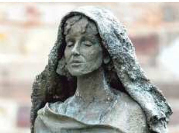
Hildegard von Bingen: eeuwenoud maar springlevend