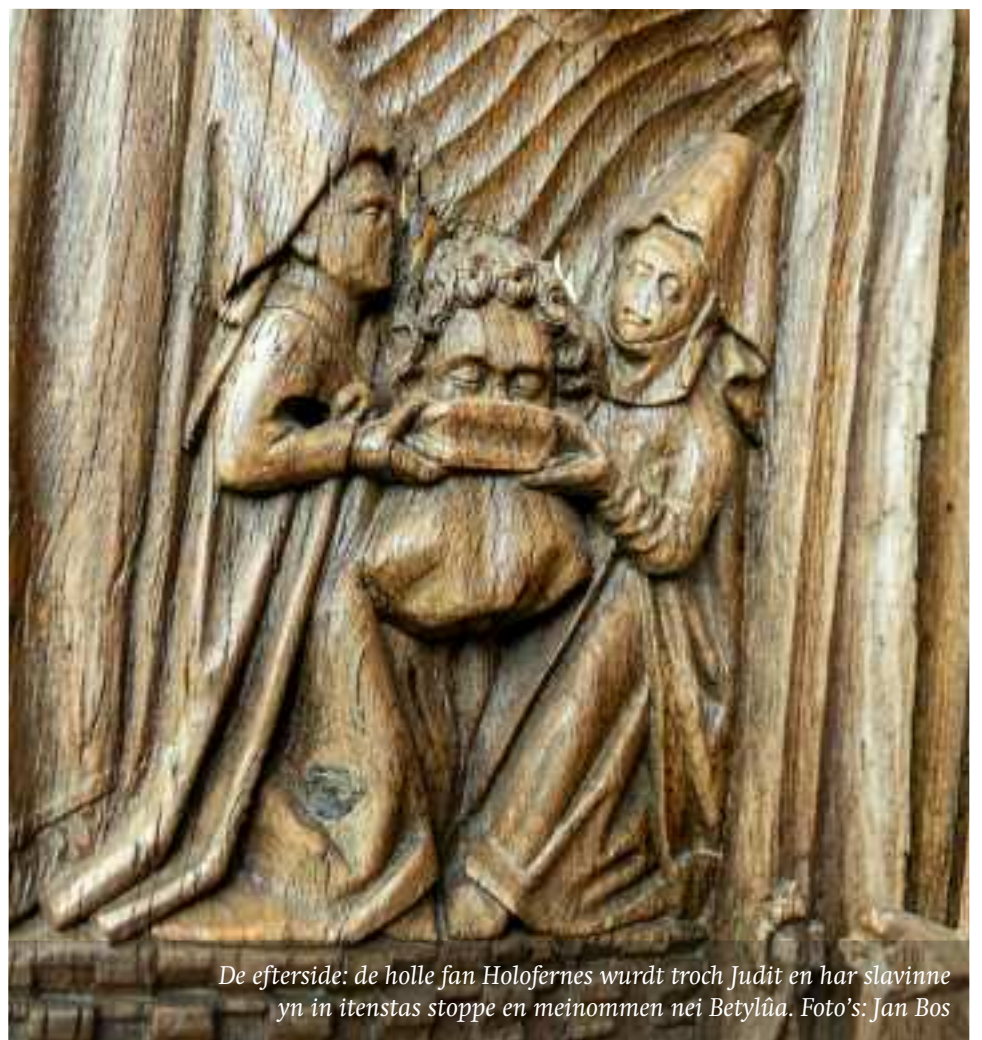
De eftsider: de holle fan Holofernes wurdt troch Judit en har slavinne yn in itenstas stoppe en meinommen nei Betylûa.