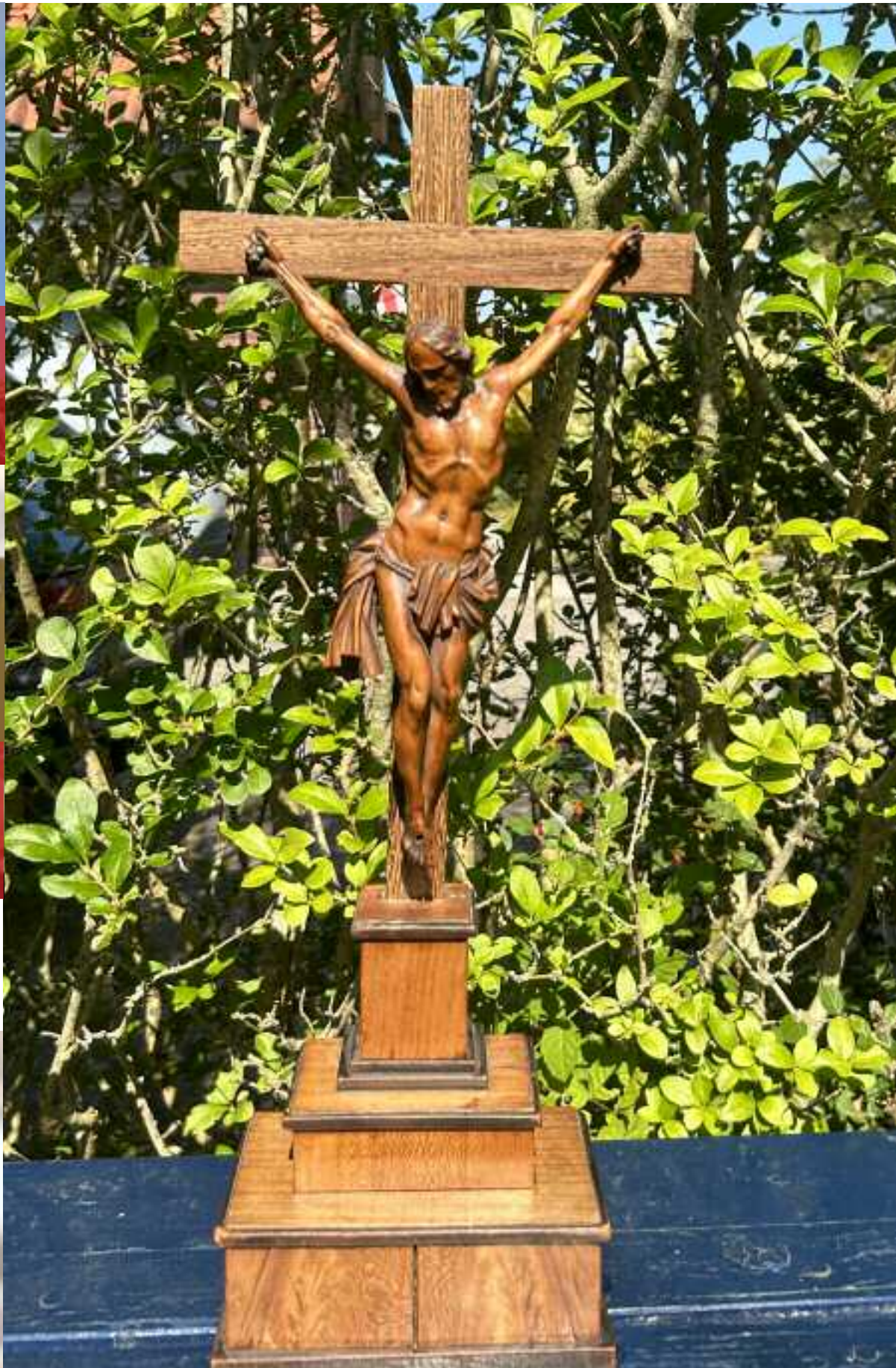
In krúsbyld mei nei skoalle