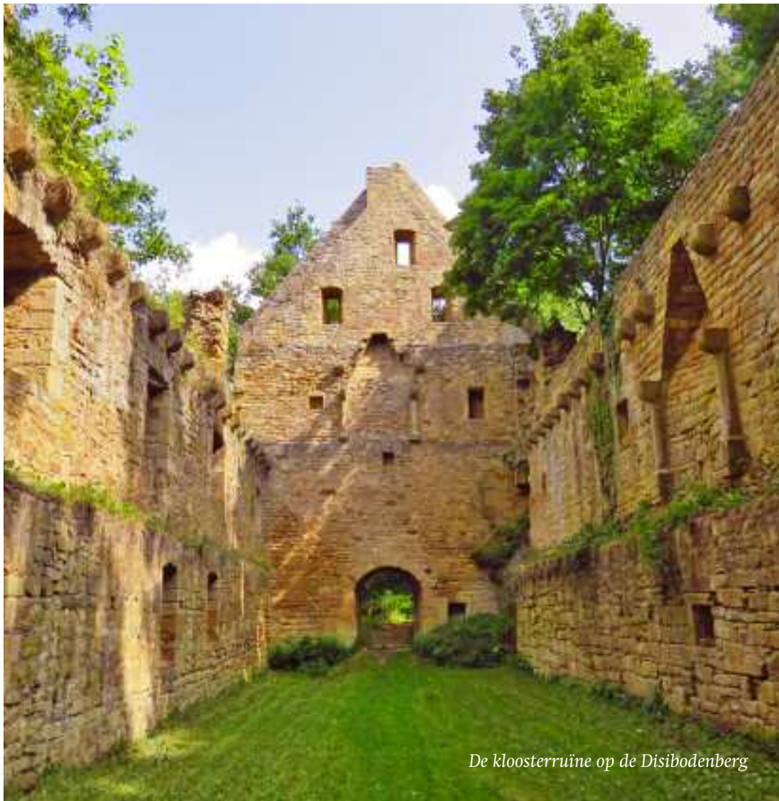
De kloosterruïne op de Disibodenberg

Het is bijzonder dat haar werk, zoveel eeuwen vergetelheid, nu weer tevoorschijn komt. Haar muziek wordt door steeds meer mensen