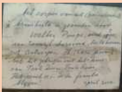
In boadskip ûnderop it byld. De famylje hie der trouwens gjin inkeld probleem mei dat ik it krigje....

Ik sette it byld op 'e groepstafel en it aparte wie: de bern fleagen der fuort op ta. Ek sûnder dat ik der mar in wurd oer sein hie, waarden sy oanlutsen troch dit krúsbyld en kamen der ek sichtber fan ûnder de yndruk. Tidens en nei it Peaskeferhaal waard it op elk lyts detail besjoen en becommentarieard, mar boppeal bewûndere, sadanich dat it my yn't hert rekke. Sels fiede ik dy moarn hiel sterk de oanwêzigheid myn freondinne, dy't fan boppenôf glimke om de ketter dy't in krúsbyld mei nei in kristlike skoalle naam. Sa sûntjes wei blyk ik dan dochs noch oecumenischer te wêzen as at ik ea tocht hie dat ik wêze soe.