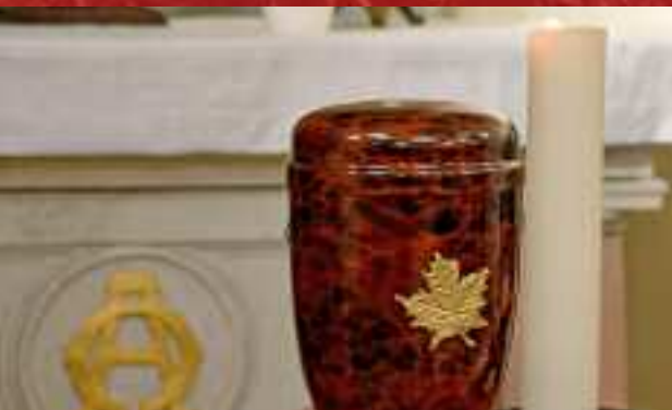
Begraven of cremeren?